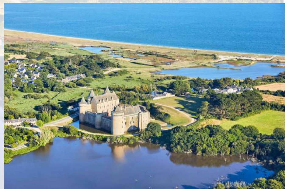
Château de Suscinio