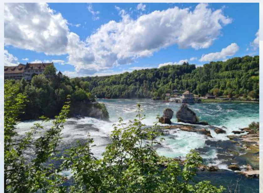
Rheinfall bei Schaffhausen