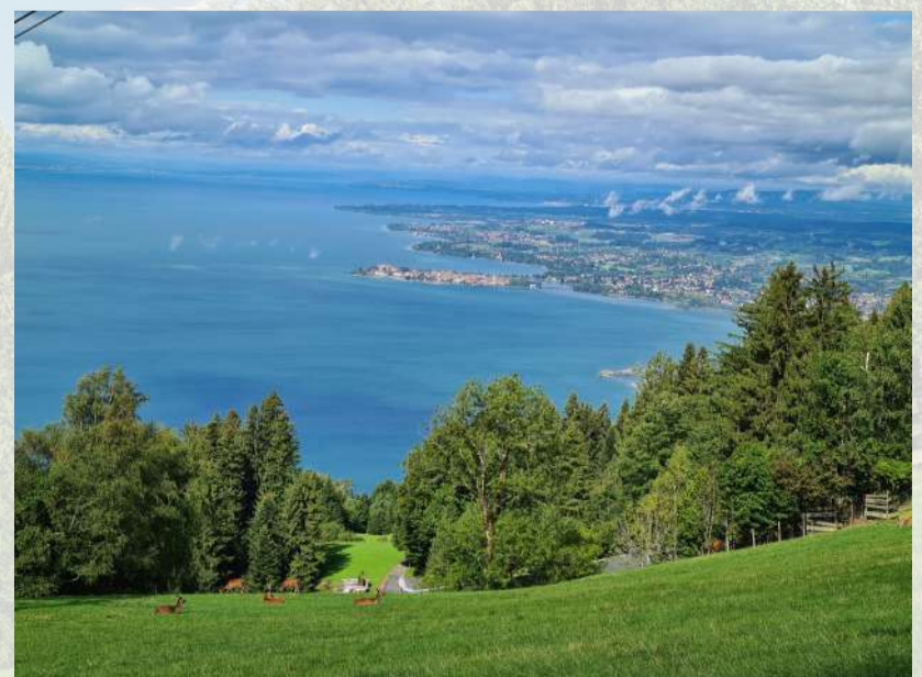
Blick vom Pfänder in Bregenz