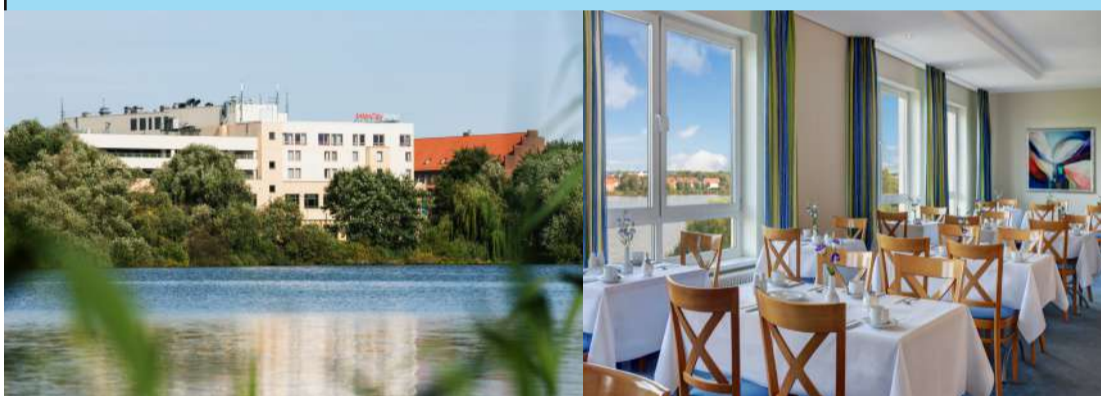
Intercity Hotel Stralsund